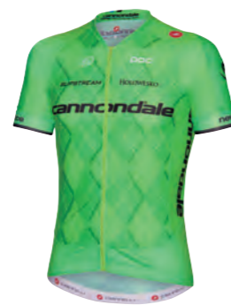
SPRINT GREEN (スプリント グリーン)