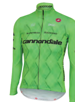
SPRINT GREEN (スプリント グリーン)