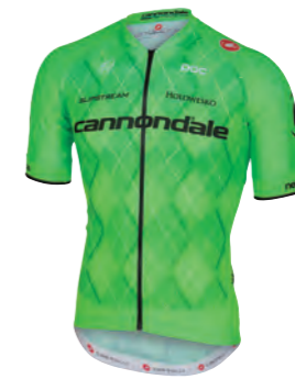
SPRINT GREEN (スプリント グリーン)